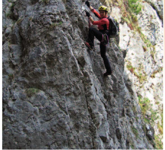
Der Einstiegs Pfeiler